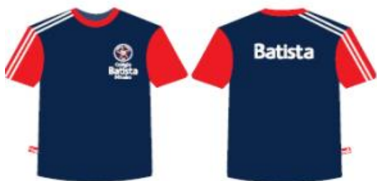
Camisa Malha PV Masculina Tradicional - COD. BAT 001 Educação Infantil ao Ensino Médio

Todas as opções de peças de uniforme recomendadas para os estudantes, conforme a idade, encontram-se disponíveis no site http://redebatista.edu.br/colégio/informacoes/uniforme-escolar