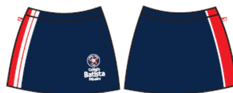
Short Saia Tactel Feminino - COD. BAT 010 Educação Infantil ao 5º ano Ensino Fundamental