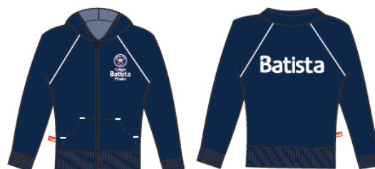
Agasalho Moletom Masculino / Feminino com Ziper COD. BAT - 006 Educação Infantil ao Ensino Médio