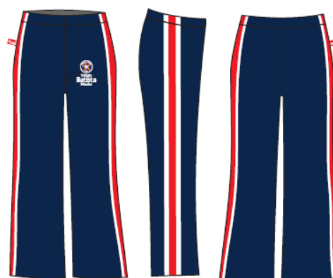
Calça Helanca Feminina - COD. BAT 011 Educação Infantil ao Ensino Médio