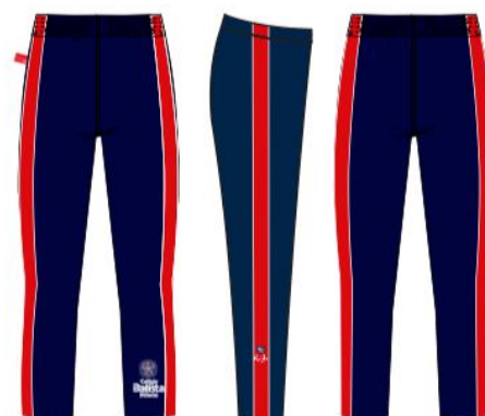
Calça Helanca Corsário Feminina - COD. BAT 014 Educação Infantil ao Ensino Médio (Opção para uso diário e aula de Ed. Física)