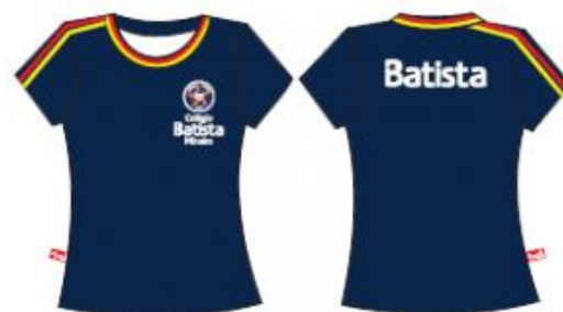
Camisa Malha PV Feminina Baby Look - COD. BAT 005 Ensino Médio