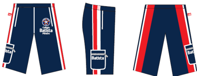
Calça Tactel Masculina - COD. BAT 009 Educação Infantil ao Ensino Médio