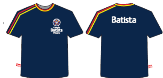
Camisa Malha PV Masculina e Feminina Tradicional - COD. BAT 004 Ensino Médio