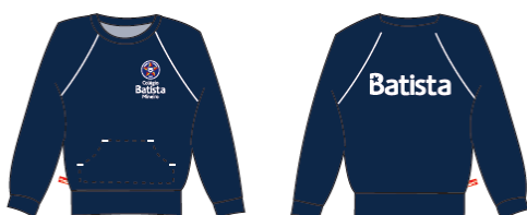
Agasalho Moletom Masculino / Feminino sem Ziper COD. BAT - 007 Educação Infantil ao Ensino Médio