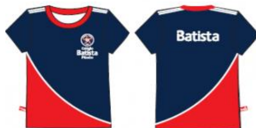
Camisa Malha PV Feminina Tradicional - COD. BAT 003 Educação Infantil ao Ensino Médio