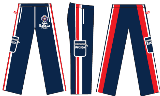
Calça Tactel Masculina / Feminina - COD. BAT 008 Educação Infantil ao Ensino Médio