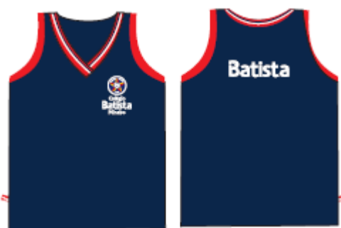
Regata Malha PV Masculina Tradicional - COD. BAT 012 Educação Infantil ao Ensino Médio